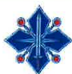
II pakāpes Goda zīmes miniatūrzīme