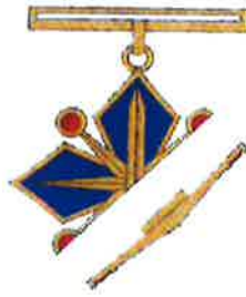
Godas zīmes diagonāls šķērs griezumus