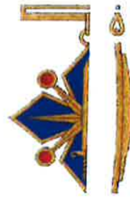
Godas zīmes vertikāls šķērs griezumus