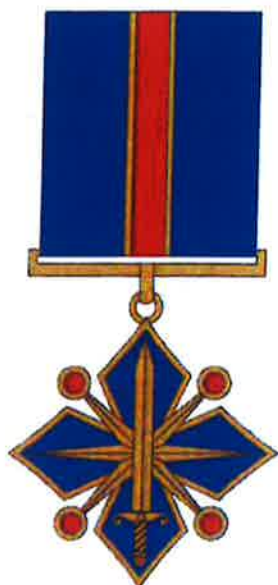
I pakāpes Goda zīme