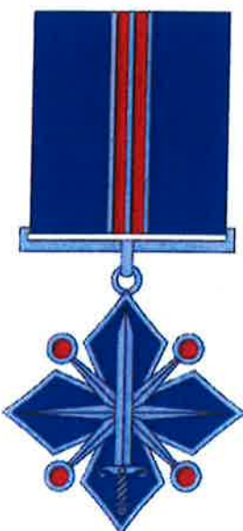
II pakāpes Goda zīme